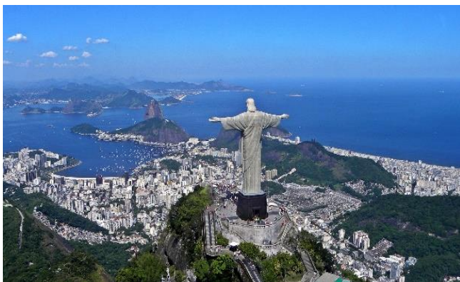
リオ・デ・ジャネイロ