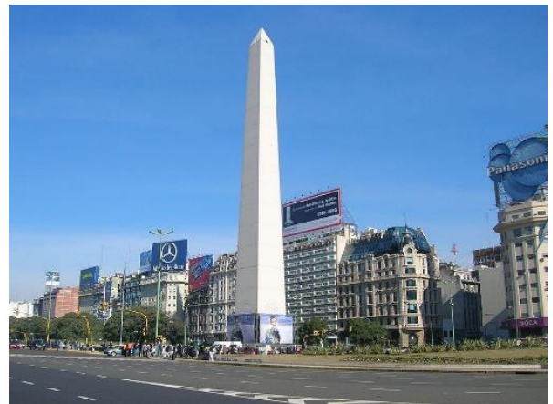
ブエノス・アイレス